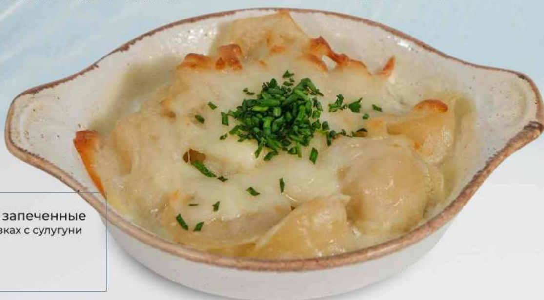
Пельмени рыбные запеченные с щукой и семгой в сливках с сулугуни